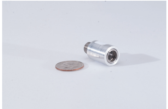
Fixed focus collimator