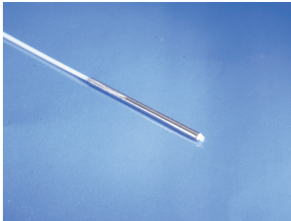
Right angled beam or collimated beams.