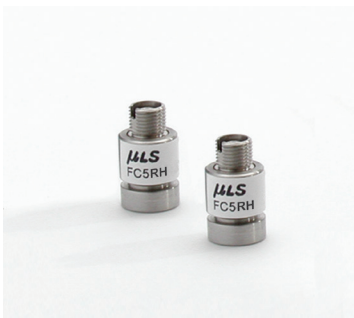
Radiation resistant collimators.