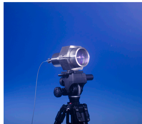
FC100 mounted on tripod

A sturdy stainless steel mount has threaded holes to mount the collimators to stages, tables and tripods.